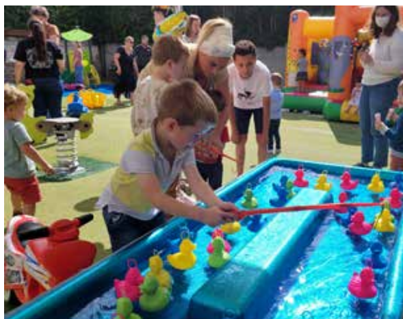
Deux MAM proposent 12 places et des animations tout au long de l'année.

La halte-garderie municipale accueille tous les enfants de 3 mois à 6 ans, à des tarifs attractifs. Il s'agit d'un accueil ponctuel, c'est-à-dire que les enfants peuvent fréquenter la structure au maximum 5 demi-journées par semaine. Deux places dites "d'urgence" sont néanmoins disponibles à tout moment pour les parents rencontrant une difficulté. Les agents