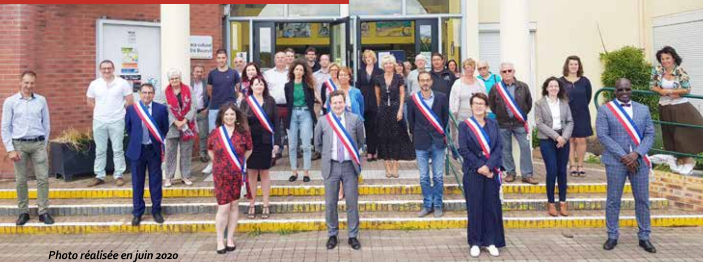
Photo réalisée en juin 2020