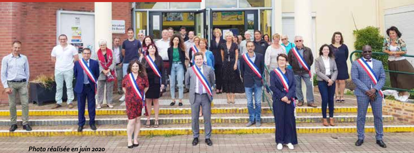
Photo réalisée en juin 2020