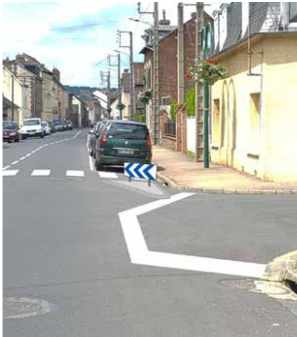
Projet d'aménagement du Stop de la rue Guillard.

La rue de la République (route de Louviers), entre la place Aristide Briand et la rue du Bec, est un des principaux axes routiers de la Ville. Plusieurs difficultés liées à la vitesse, au stationnement intempestif, au manque de visibilité des sorties ont été étudiées par les services de la Métropole. Des travaux d'aménagement seront réalisés cet été.