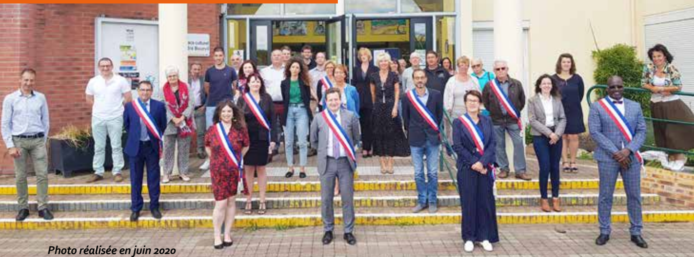
Photo réalisée en juin 2020