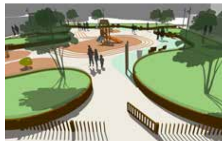
Le cœur du forum, un grand espace familial et de jeux

Centre du quartier, elle proposera un lieu de convivialité pour les familles et un espace ludique pour les plus petits. Des banquettes, des jeux et des espaces de pause seront réalisés et des jardinières seront installées. Les lieux seront accessibles aux personnes à mobilité réduite.