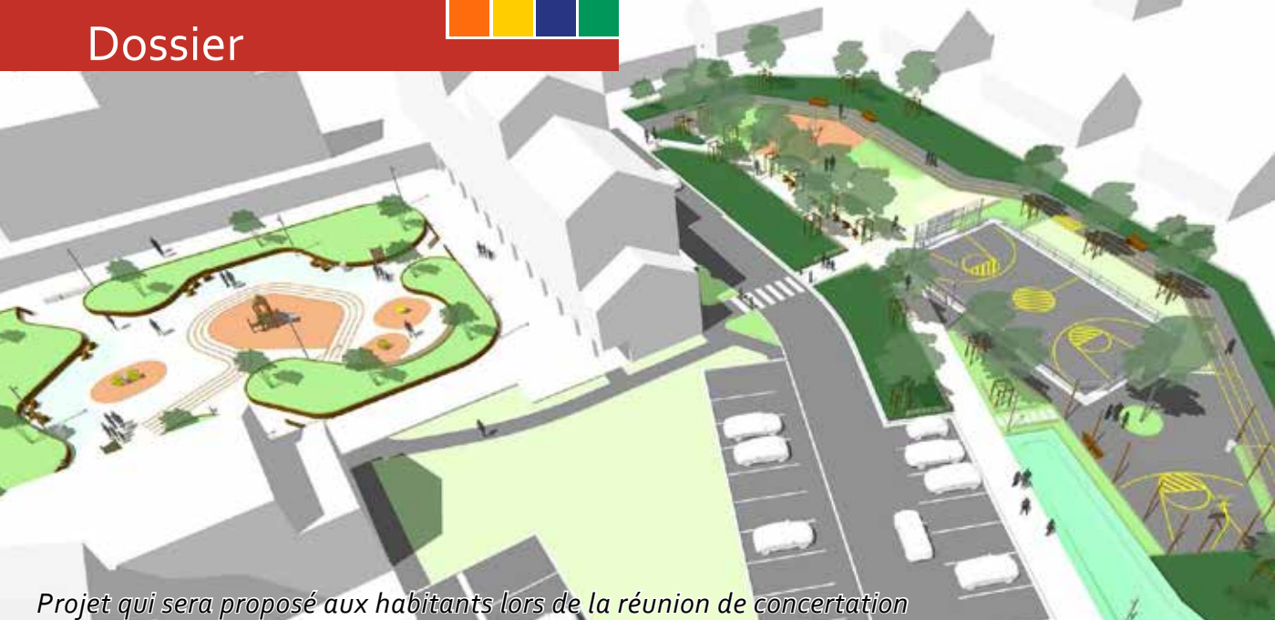
Projet qui sera proposé aux habitants lors de la réunion de concertation