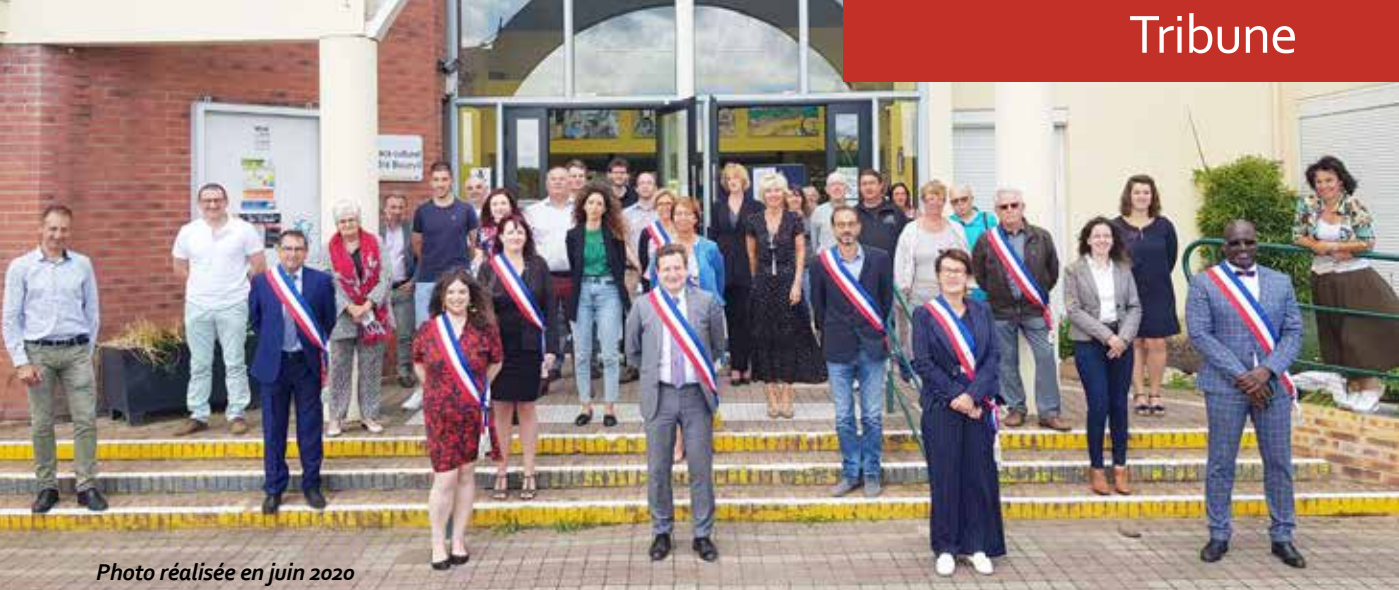
Photo réalisée en juin 2020