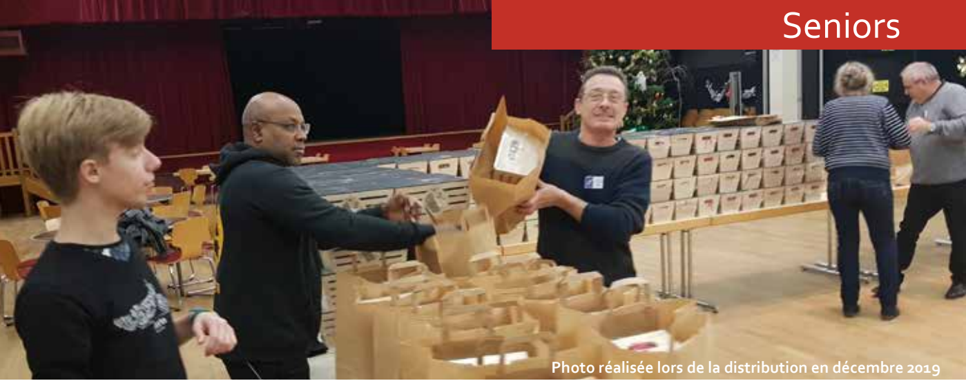
Photo réalisée lors de la distribution en décembre 2019