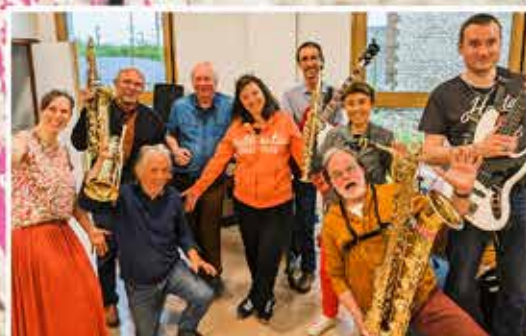
Animation musicale par le groupe "Les Jazzim'ut"

Rendez-vous sur le parvis de la Mairie - Inscriptions sur place À 9h pour les 10 km (départ à 9h30) / À 10h pour les 5 km (départ à 10h30)