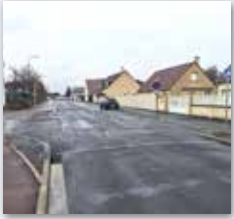
LA RUE EUGÈNE POTTIER RÉAMÉNAGÉE