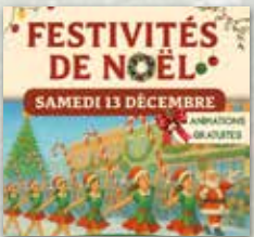
LA MAGIE DE NOËL S'EMPRE DE CAUDEBEC